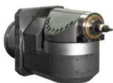
Frézování - Soustružení

Projekty na klíč. Individuální řešení podle požadavků zákazníka.